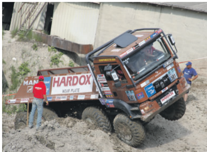
Die Jury beobachtet die Schwerstarbeit im tiefen Sand

Die Felsenpassage ist es, die dem Lokalmatador aus Lauchheim die Sorgenfalten auf die Stirn treibt. Vorhin quälte die einzige Mädchencrew - „Drei Engel für HK“ - ihren Mercedes-8x8 über dieselbe Stelle. Und fing sich einen Felsbrocken so groß wie