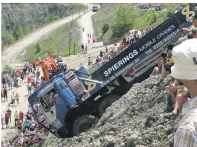
Mitten drin im Publikum: Die Abfahrten in der Falllinie des Bergs sind besonders spektakulär