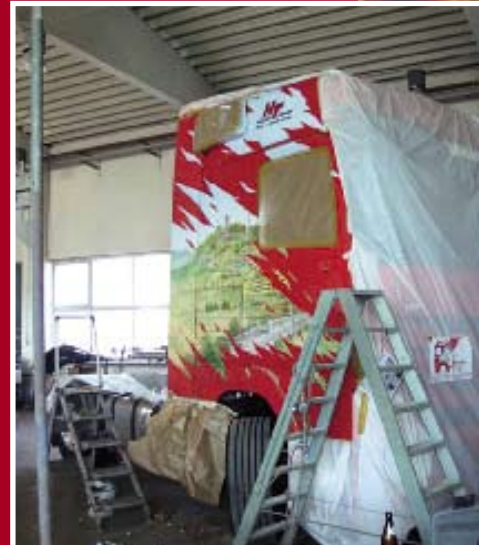
Pistolero: Actros beim Besprühen

sichten der Nürburg auf den Seiten des Fahrerhauses auf. Klar, dass der LKW beim Truck-Grand-Prix einen Ehrenplatz bekommt.