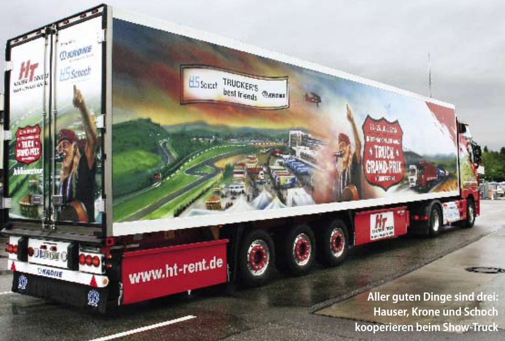
Aller guten Dinge sind drei: Hauser, Krone und Schoch kooperieren beim Show-Truck