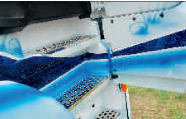
Innen: Das blaue Band geht auch über die Kanten und Ecken des Einstiegs hinweg.