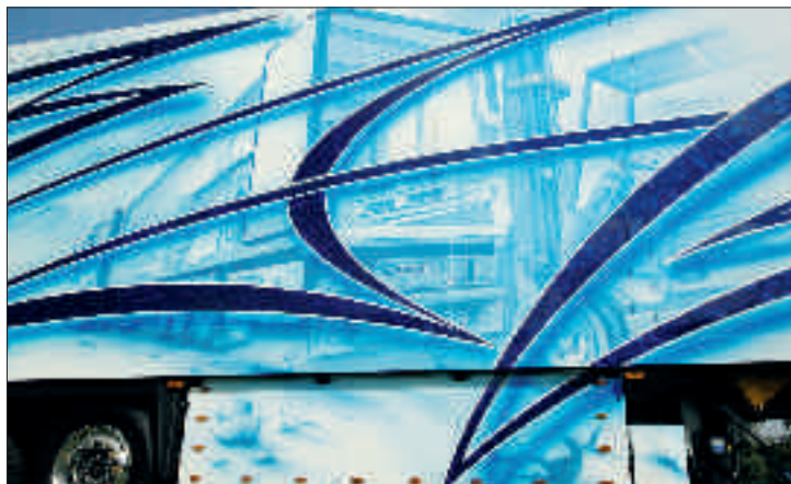
Links: Szenen aus dem Speditionsalltag zieren die Beifahrerseite.