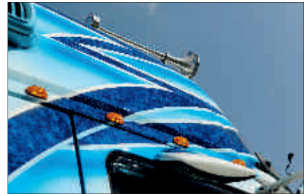
Oben: Zusatzbeleuchtung und Edelstahlzubehör ergänzen das schöne Outfit.

W erbebotschaften auf einem Kühlzug sind in der Regel recht fix gemacht: Aufschriften oder Klebefolien auf den Koffer und fertig ist die rollende Litfaßsäule. Der neuste Streich der MM Transport GmbH ist zwar auch ein Kühlzug, aber in jeder Hinsicht ein vielfach aufwendigerer Werbeträger. Klebefolien sind hier nämlich Fehlansage. Stattdessen legte Airbrush-Künstler Walter Rosner Hand an Zugmaschine und Koffer. Zwar kommt er dabei mit den beiden Grundfarben Blau und Weiß aus, schlicht ist das Kunstwerk auf Rädern aber deshalb noch lange nicht.