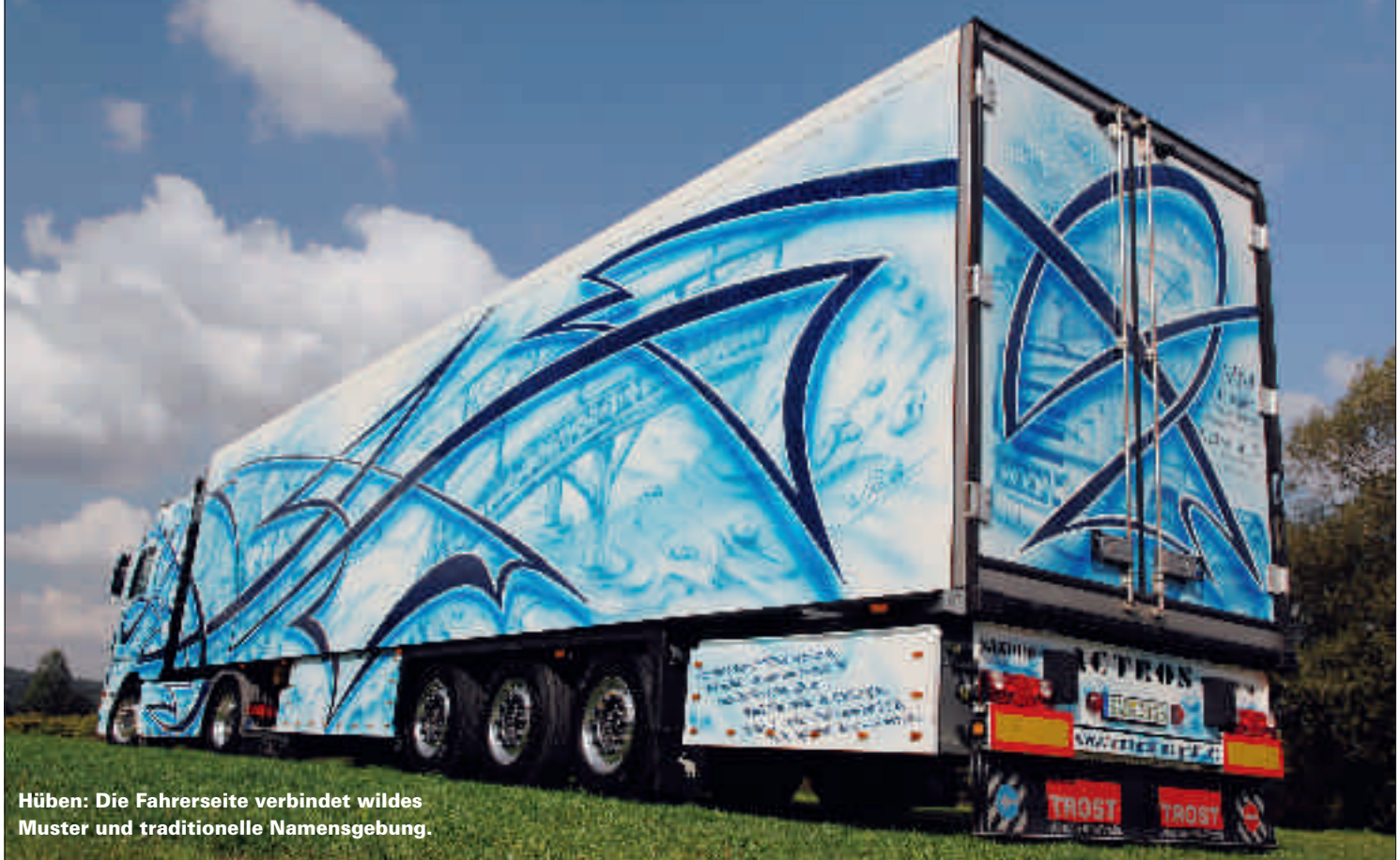
Hüben: Die Fahrerseite verbindet wildes Muster und traditionelle Namensgebung.

Die eigentliche Botschaft der Lackierung liegt aber unter den dynamischen Linien und auf der Fahrerseite stellen die Gemälde schon fast ein kleines Rätselspiel dar. Eine nostalgische Mühle weist auf den Speditionseigner Markus Mühl hin. Etwas weiter hinten steht eine alte Brücke aus Holzbohlen sinnbildlich für den Heimatort der Spedition. Im bayerischen Dialekt heißt eine Brücke nämlich „Bruck“, wie der Speditionssitz.