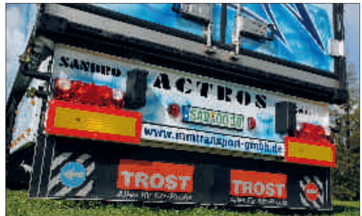
Unten: Gelaserte Schriftzüge veredeln das Heck des Kühlers.